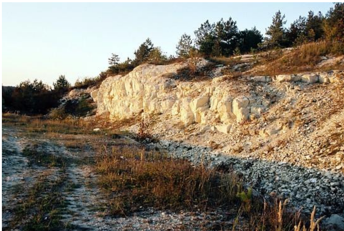
Kamieniołom w Bliżowie