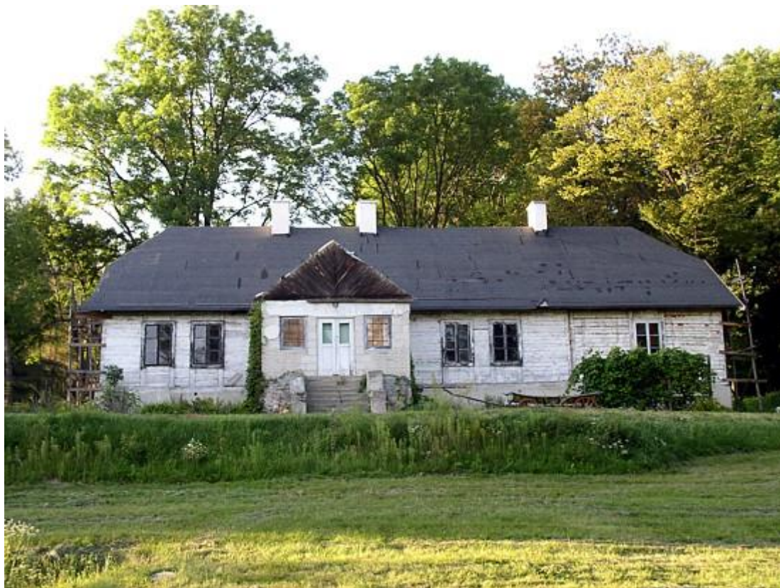
Budynek dworu w Adamowie

W Rachodoszczach z obiektów kubaturowych zachował się drewniany dwór (ok. 1932 roku) oraz pozostałości parku.