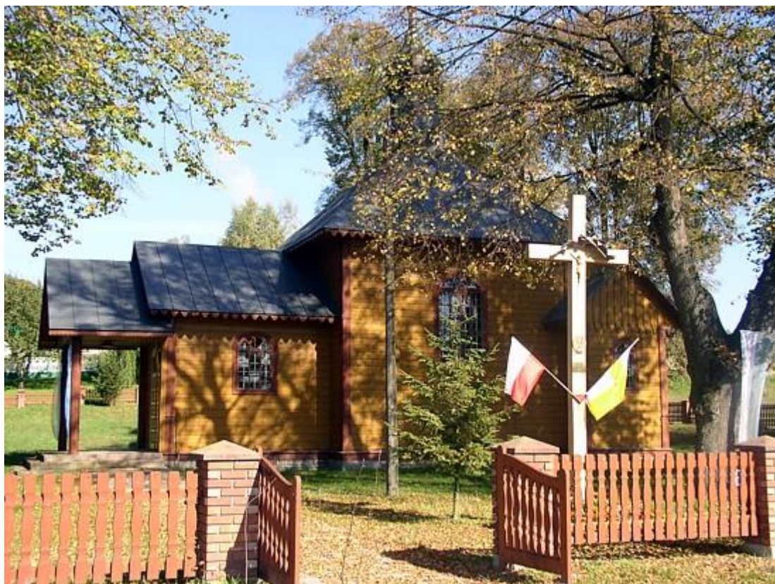
Kościół w Szewni Dolnej

W Suchowoli znajduje się zespół kościoła prawosławnego p.w. Przemienienia Pańskiego. Kościół murowano w latach 1935 – 1938. Przy kościele usytuowano w początkach XX wieku cmentarz, obecnie nieczynny.