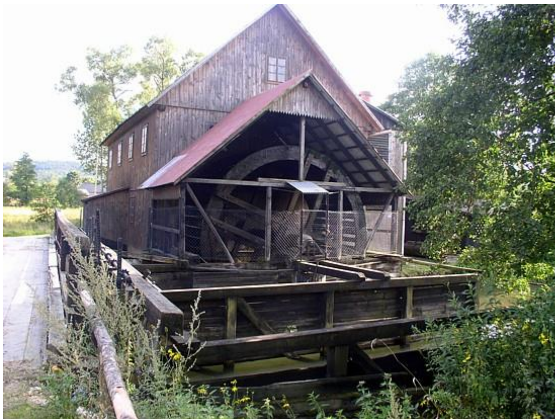
Młyn wodny w Bondyrzu

wpisany do rejestru zabytków. Drugi postawiony w 1936 roku chroniony jest pośrednio poprzez ujęcie w ewidencji zabytków. W Rachodoszczach zachowała się drewniana kuźnia datowana na około 1900 roku.