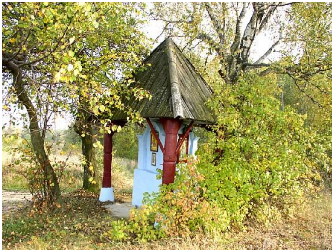
Kapliczka w Grabniku