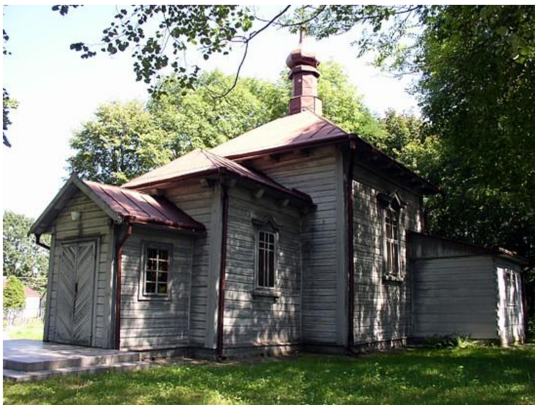
Kościół w Potoczku