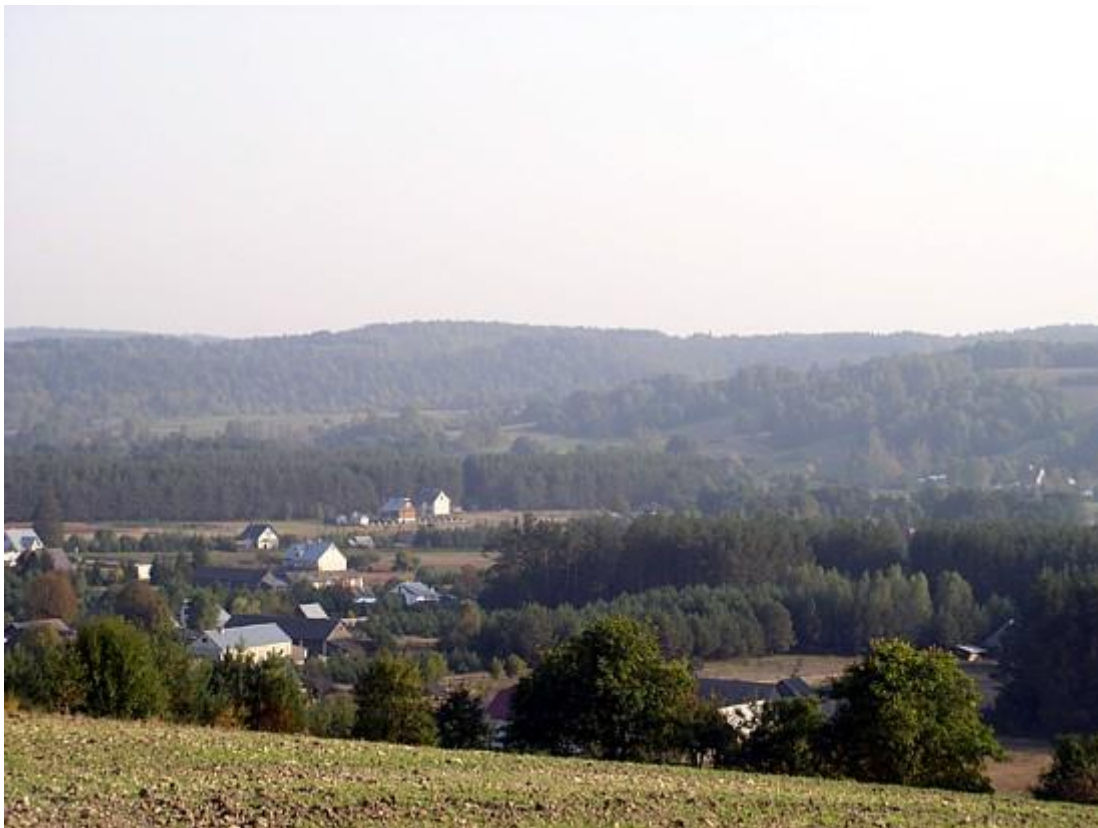
Roztocze na terenie Gminy Adamów